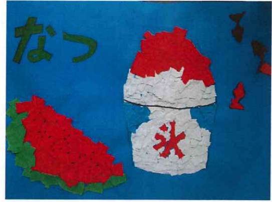
社会福祉法人 陶技学園 指定障害者支援施設 第二陶技学園 題字・山本英子様