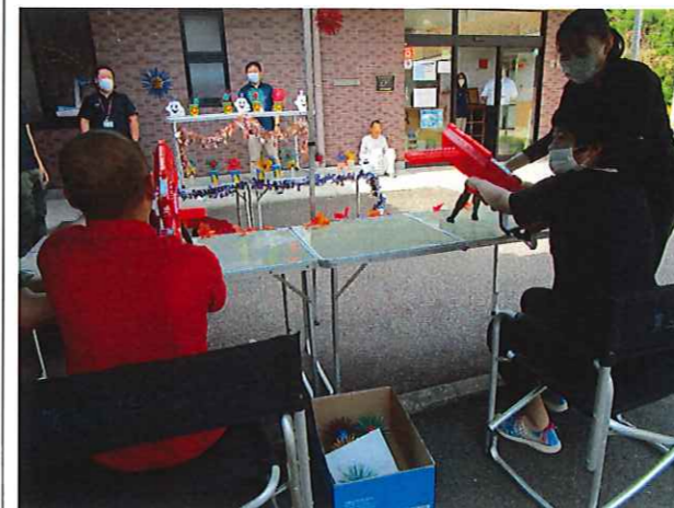
ウィルスバスター(的当て)ゲーム