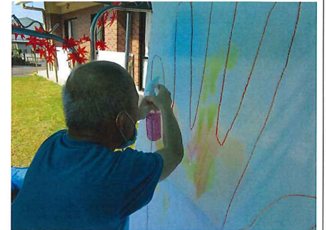
消毒スプレーアート