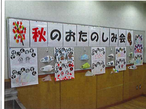
デザインマスクの展示