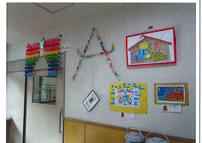
A グループ利用者の個々の作品