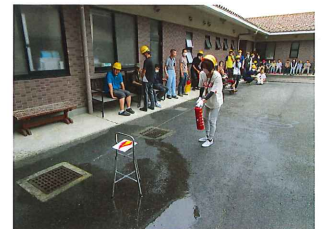
消火訓練を行いました。