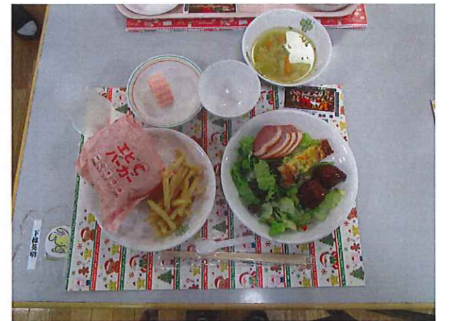
クリスマスのメニュー