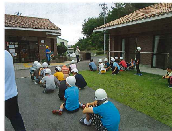
中庭に避難をしました。